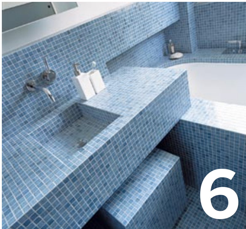
6: Nischen, Simse und ein Rollkorpus unter dem Waschbecken erlauben in den Bädern eine optimale Raumausnutzung.